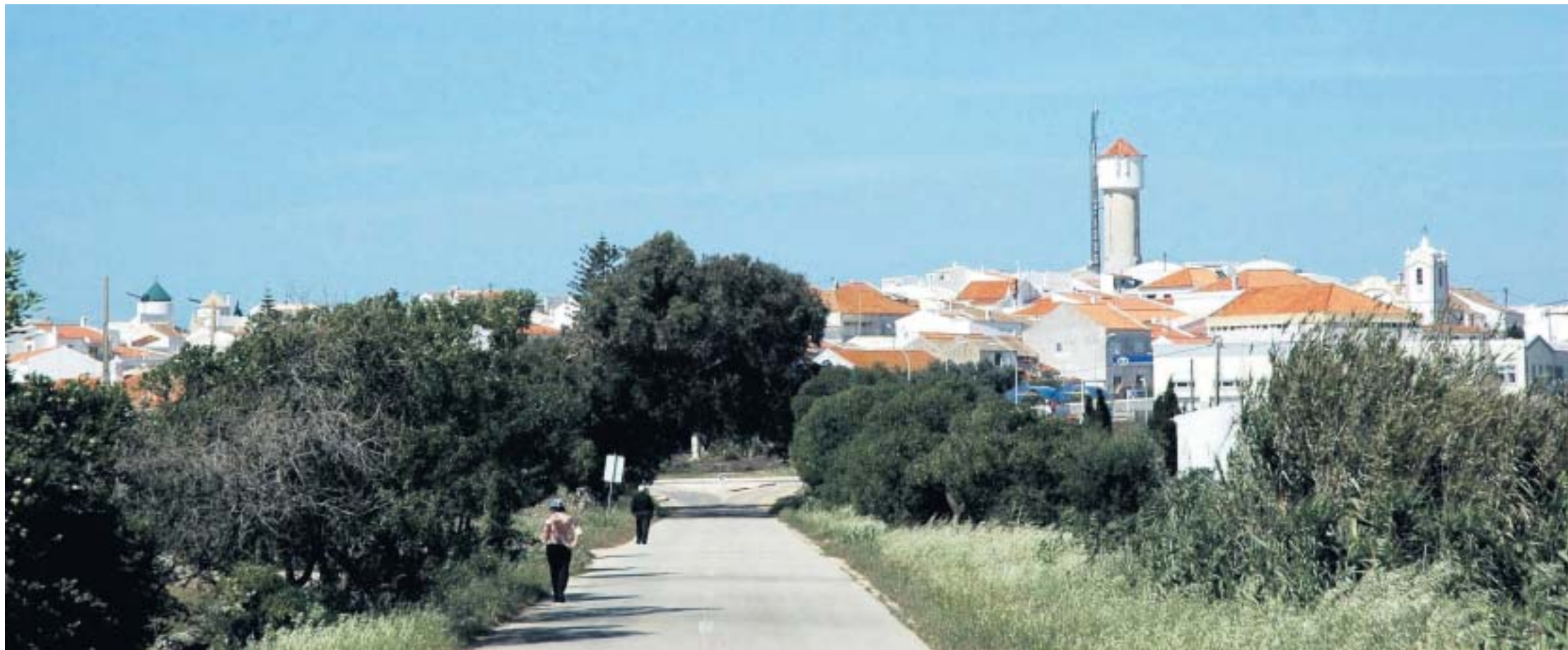
Voor de liefhebber begint het echte Portugal in Vila do Bispo.