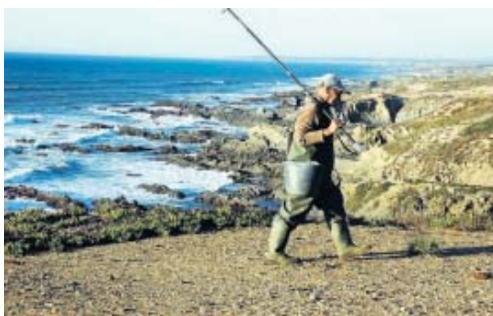
Visser aan de zuidwest kust van Portugal.

De nacht valt hier vroeg. Voor tielken lig ik tussen de strakke lakens te luisteren naar de branding en een onvermoerbare krekkel. De wind gaat liggen en naarmate de duisternis valt spreidt de sterrenhemel zich uit over dit deel van de aarde waar