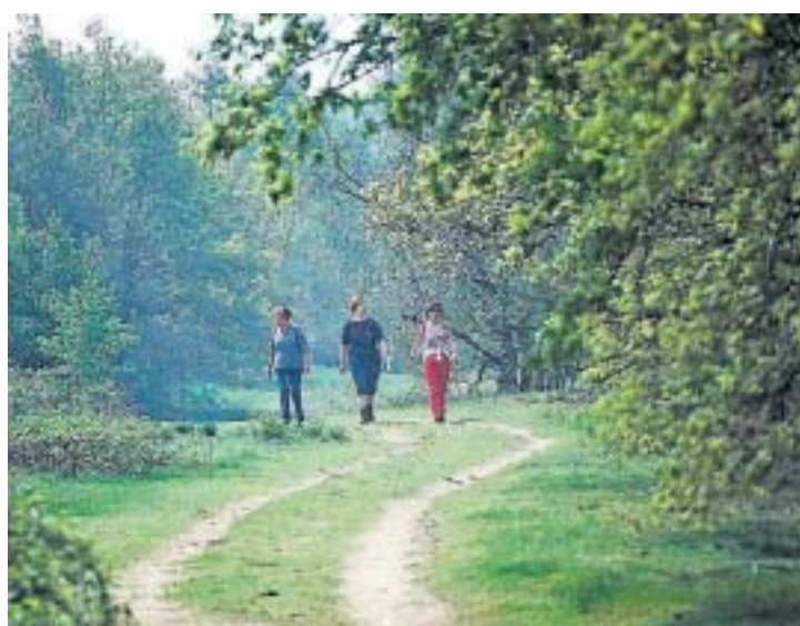
Lekker met z'n allen de natuur in.

moeten gaan sleutelen. En, dringen geblazen op de fiets- en wandelpaden, want beide vormen van vrijetijdsbesteding zijn ook nu al razend populair. Wij Nederlanders wandelen en fietsen het liefst in een afwisselende omgeving met natuur. De belangrijkste redenen om te gaan wandelen en fietsen zijn gezelligheid (respectievelijk 62 en 55 procent) en de gezondheid (respectievelijk 54 en 55 procent), zo blijkt uit onderzoek. Bij fietsen komt daar nog een belangrijke reden bij: sportief bezig zijn (54 procent). Jaarlijks ondernemen we met z'n allen 427 miljoen wandelingen en 205 miljoen fietstochten.