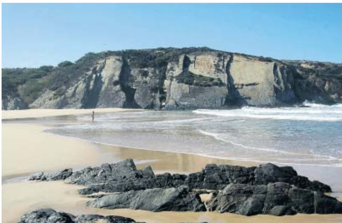
Tientallen van dit soort strandjes vind je aan de zuidwest kust van Portugal.

Maar wij zetten onze ontdekkingsreis voort over land. De weg naar het noorden, richting Lissabon, loopt grotendeels uit de kust, zodat je vaak kleine, soms onverharde wegen moet inslaan om bij de oceaan te komen. Als je pech hebt loop je vast op het rommelige erf van een armoedige boerderij, waar